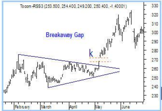
ตัวอย่าง Gap ขึ้น