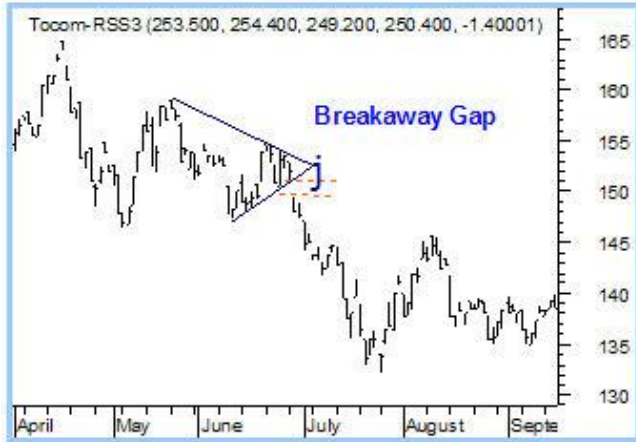
ตัวอย่าง Gap ลง